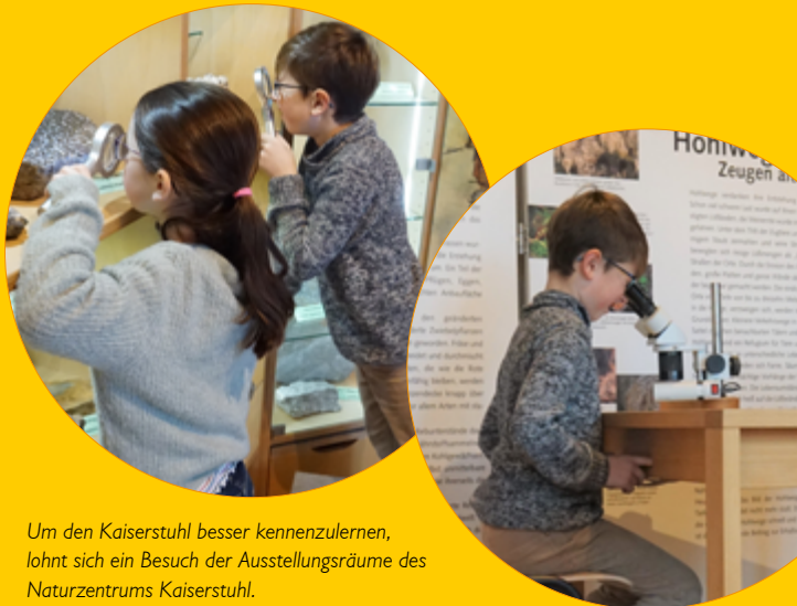
Um den Kaiserstuhl besser kennenzulernen, lohnt sich ein Besuch der Ausstellungsräume des Naturzentrums Kaiserstuhl.

Öffnungszeiten: Mo. + Do.: 10 – 12 Uhr (Büro besetzt) und Sa.: 16 – 18 Uhr Das Naturzentrum ist von März bis Oktober geöffnet.